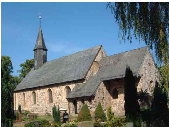
Kyrkan i Haddeby

Med oss hade vi ovannämnda uppgifter ur Robert Murrays bok. Staden Schleswig ligger vid norra stranden av den sjö, som bildar den innersta delen av fjorden Schlei, vilken i sin tur sträcker sig ca 40 km i NO riktning till Östersjön. Haddeby ligger vid södra stranden av samma sjö, fågelvägen ca 1,5 km från Johannisklostret. Vi besökte först kyrkan i Haddeby (nära det fina vikingamuseet). Kyrkan var dock stängd och vi gjorde oss inga ansträngningar att komma in i den eftersom vi inte hade någon anledning att tro att det skulle finnas några minnen efter Andreas där. Vi tog dock ett fotografi av kyrkan.