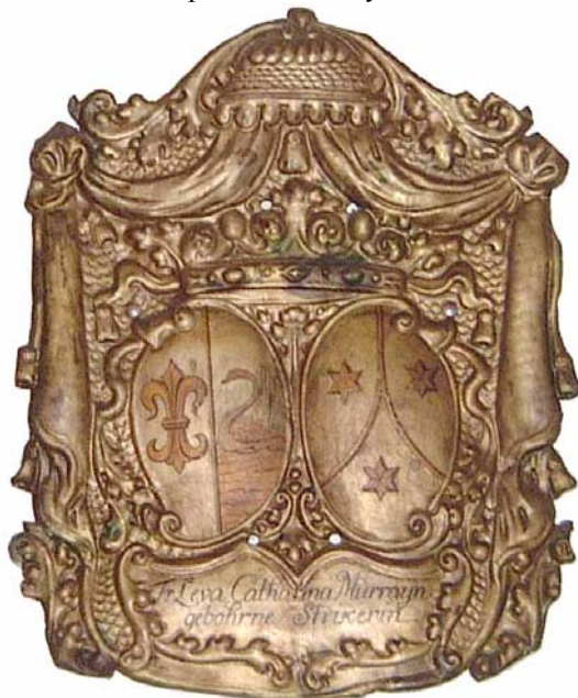
Vapenskölden i refektoriet