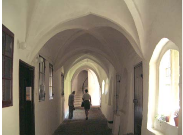
Svalgång ("Schwahl") i klostret