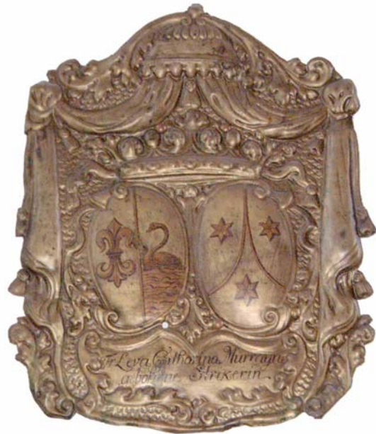
Vapenskölden i Kyrkan