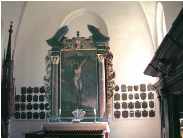
Huvudaltaret med vapensköldar Leve Catharinas sköld är nummer fem från vänster i andra raden (till vänster om altartavlan)